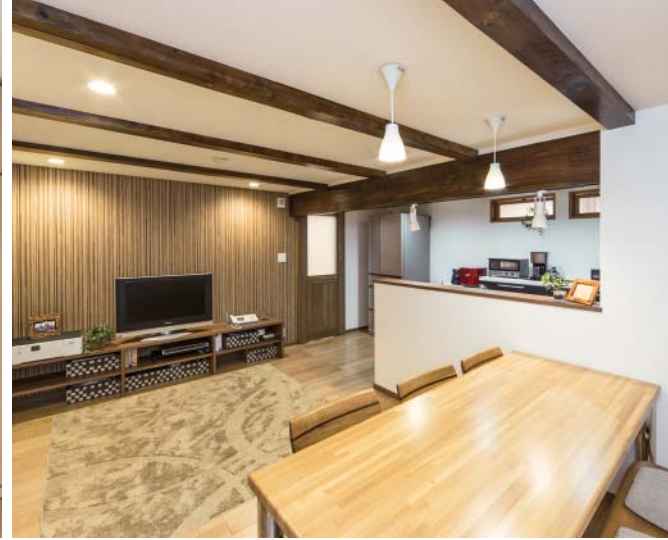
祖母が創作活動しやすいようにカウンターデスクを造作 1階LDKは「対面キッチンになって料理中も子どもを見守れるようになりました」