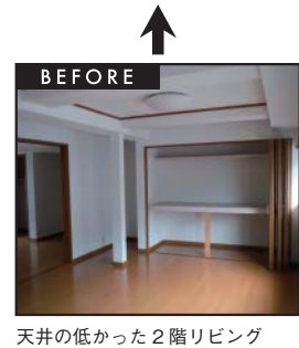
天井の低かった2階リビング