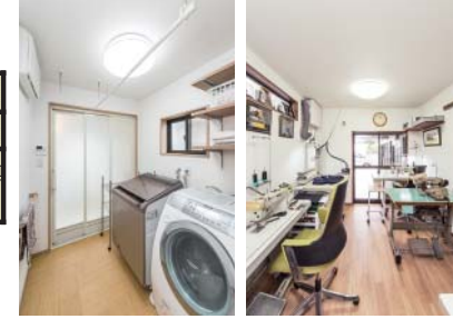
脱衣室は物干し場も兼用 コンパクトにした作業場 スキップフロアの下部は大きな収納スペースに