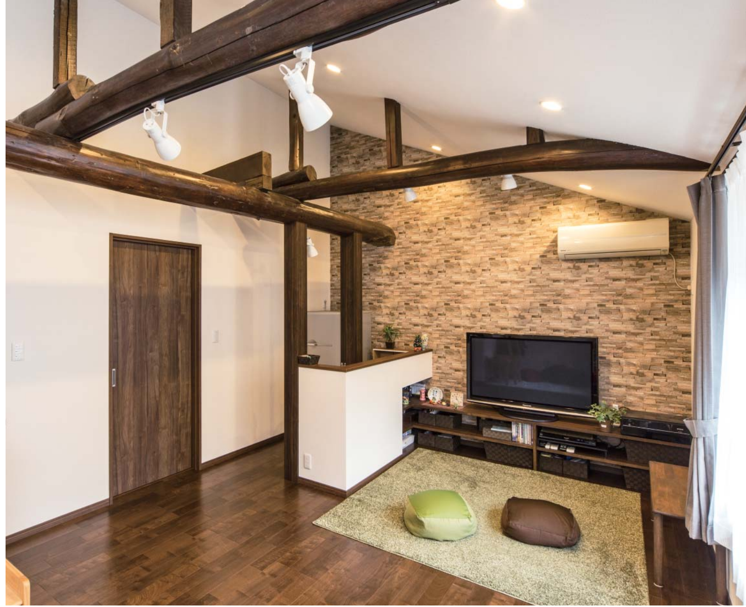
圧迫感のあった2階リビングは梁を見せることでこの通り開放感いっぱい！「この味のある梁を眺めるのが好きなんです」と妻