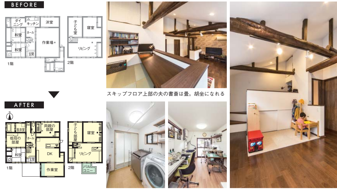
スキップフロア上部の夫の書斎は畳。胡坐になれる