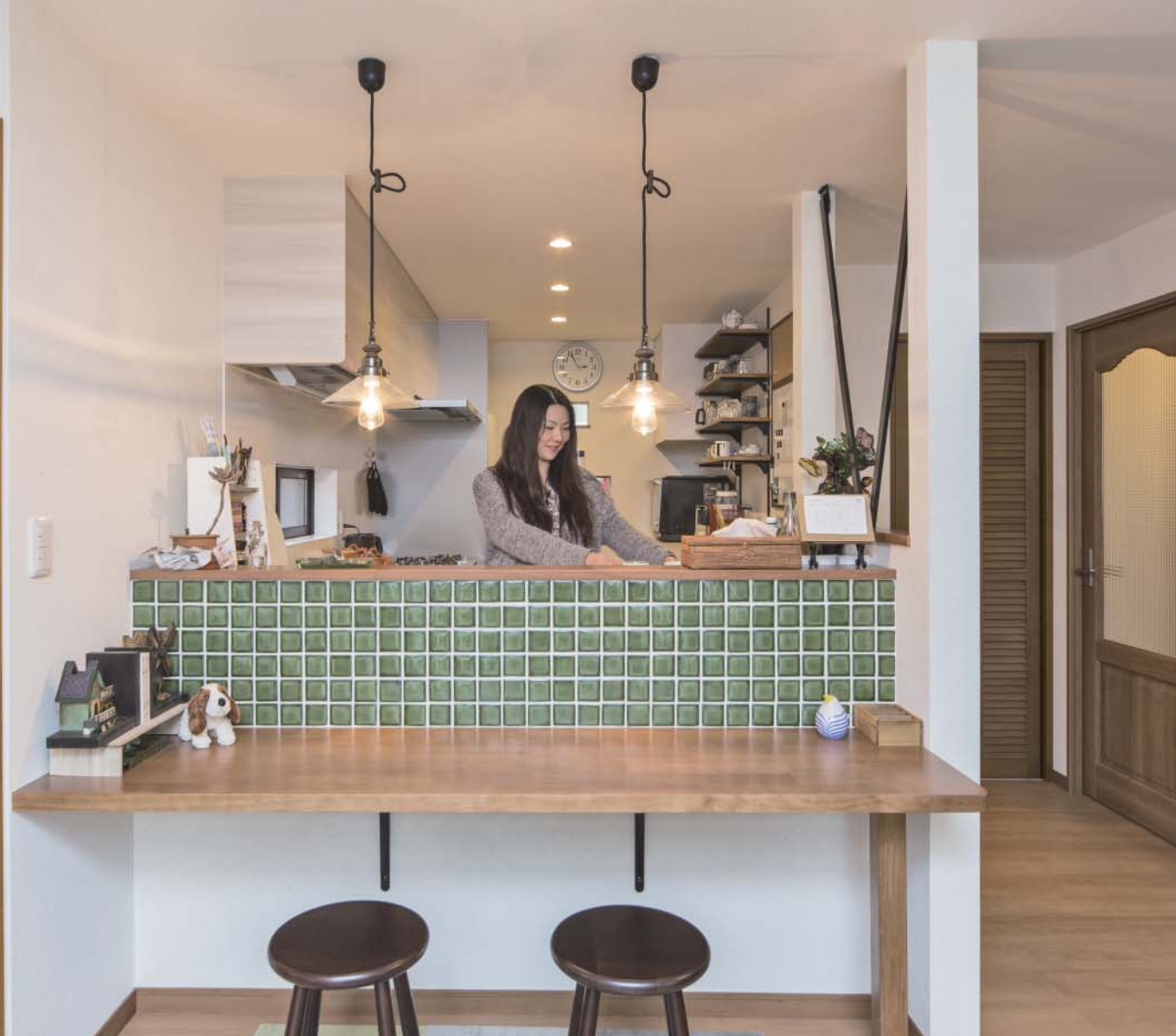
グリーンの表情豊かなタイル、レトロなペンダントライトでNさんの好きなカフェスタイルに。家族のだんらんも自然に増える