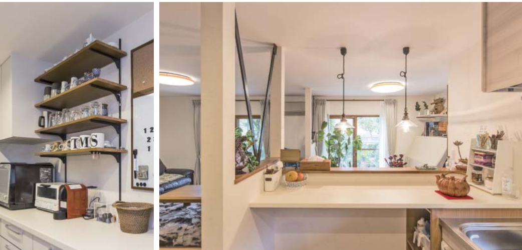
カフェ風のオープン棚 明るく開放的になったキッチン。カウンター前の作業スペースも広くして使いやすさもUP！