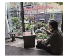
庭を眺めながら一杯、が父の日課