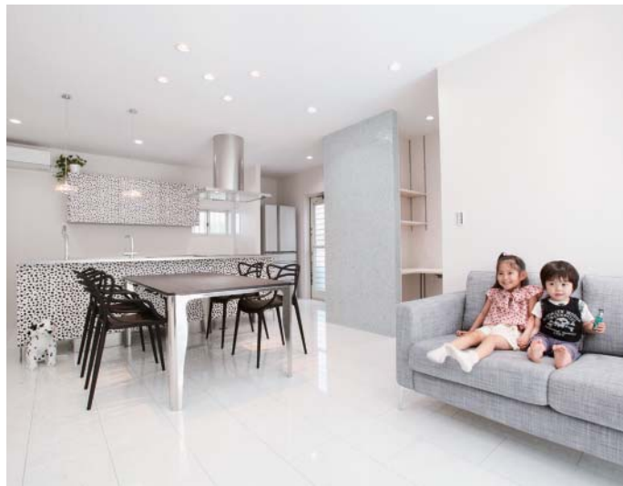
妻のこだわり満載のLDK。「プランナーの方の提案で、ベネツィアンモザイクタイルを耐力壁に貼ったのが大正解。キッチンから見ると、自然光や照明が反射してキラキラきれいです」