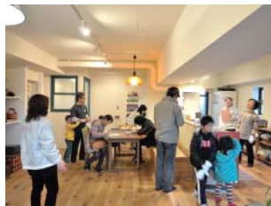
リフォーム完成見学会風景

同社でリフォームしたお施主様は満足度がとても高いため、見学会に協力してくれる方も多し。完成見学会ではBefore、AfterをPOPでわかりやすく紹介し、スタッフなしでの見学も可能。詳しい日時はHPのイベント情報をチェックして、是非足を運んでみよう。