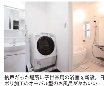
納戸だった場所に子世帯用の浴室を新設。日ボリ加工のオーバル型のお風呂がかわいい