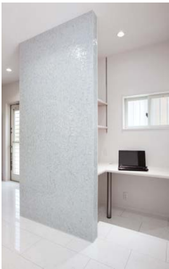
とれない鉄骨柱のある壁で間仕切ったPCコーナー。ベネツィアンモザイクタイルが光る