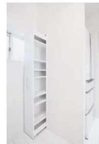
冷蔵庫を置く場所の奥側にあった隙間を可動型スパイスラックをつくることで有効活用