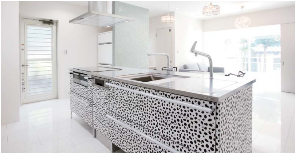
ダルメシアン柄の個性的なキッチンから寝室兼プレイルームで遊ぶ子どもの様子がよく見える。寝室兼プレイルームには子どものおもちゃやふとん、洋服がうまくおさまるようサイズを測って設計。寝室の奥にはウッドデッキが広がる。勝手口は小窓の開口部を広げて新設