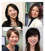
間取り図は、非改装部分が省略されています

同社では女性スタッフがお客様に寄り添い、些細な事も聞きもらさず要望をじっくりとヒアリングしてプランに活かす。