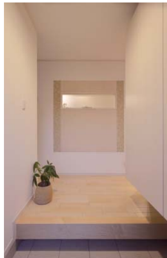
玄関は増築しLDKとの間に明かり採り窓のある壁を造作。右はリビング、左はキッチンへ