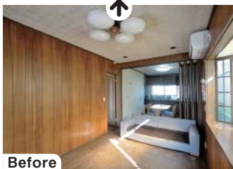
細長いLDK。「北側のキッチンにいると子どもに背を向けて目が届かないのが不満でした」