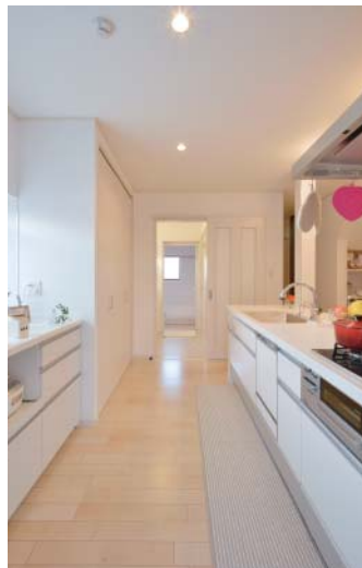
2way洗面室とキッチンは一直線動線で「子どもが風呂に入る様子まで見えます」と好評