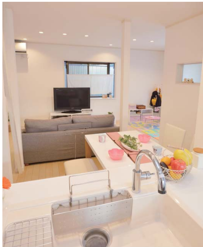
妻念願の800×2750mmの対面式キッチンからLDの様子がよく見える。階段もリビングを必ず通る動線に変更。寒かったリビングは複層ガラスにして断熱性能UP。床暖房も実現