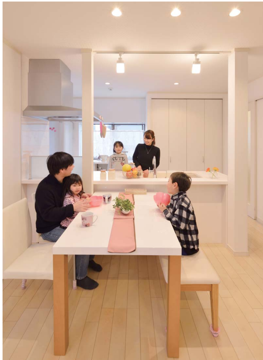
1階は壁と天井、床を取り払ったスケルトンリフォーム。耐震診断の結果、必要な箇所は補強を実施。段差のあった天井や床を同じレベルに整え、残った柱はダイニングをゆるやかに間仕切る役割を果たす。キッチン背面に大型パントリーを造作。「女性目線の提案ですごく便利です」