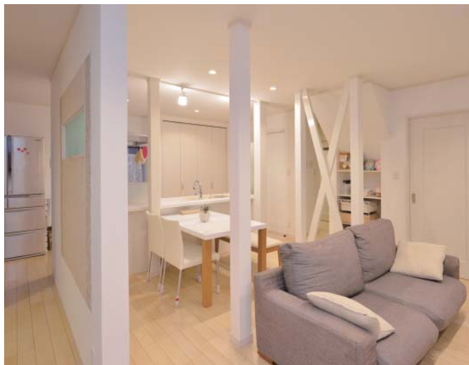
白を基調にシンプルにまとめたLDK。柱で囲まれたダイニングを中心にぐるぐる回る間取りに。構造上必要な筋交いは白塗装してデザイン性UP。防菌、抗傷効果のある壁紙は夫の選択