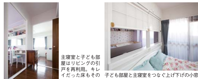
主寝室と子ども部屋はリビングの引戸を再利用。キレイだった床もそのまま活かした 子ども部屋と主寝室をつなぐ上げ下げの小窓。目覚まし時計を置くスペースも