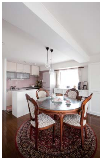
キッチンとダイニングテーブルの間のカウンターもオリジナル。下は収納になっている