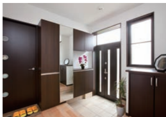
採光を取り込む工夫により、閉塞感を感じない設計に。1階玄関の横はキャットルーム