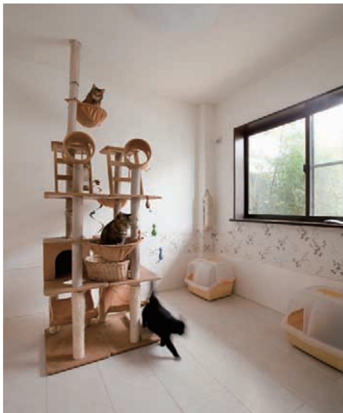
高い所に登ったり、狭い場所に隠れたりするのが好む猫のために、天井が一番高い1階をキャットルームに。「扉を開けたままでも部屋から出ないくらい、いつも楽しそうに遊んでいます」