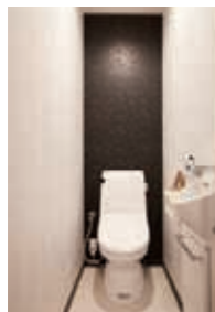
トイレには息子さんを選んだ壁紙を採用し、愛着たっぷり。空間のアクセントにも効果的