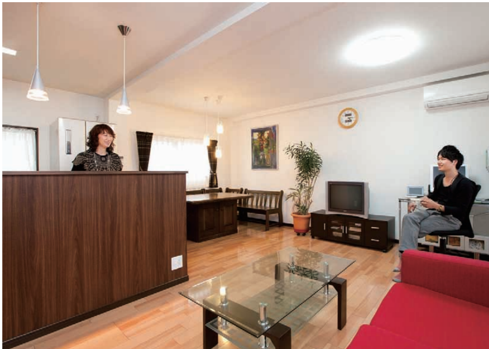
2階LDKだけでなく、すべての居室に床暖房を設置。「冬はエアコンをほとんど使いませんでした。おかげで光熱費も以前と比べてだいぶ安くなりました」と夫人。東邦ガスと提携している同社のスケールメリットを最大限に活かし、手の届く価格で床暖房を叶えることができた