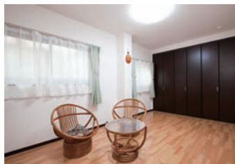
使われてなかった1階の和室をなくし、ゲストルームに。来客の宿泊部屋としても大活躍