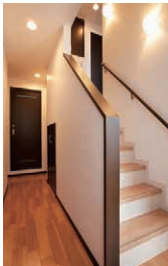
デッドスペースをなくすため階段下の空間も収納に有効活用。奥は洗面室へと続く(中2階)