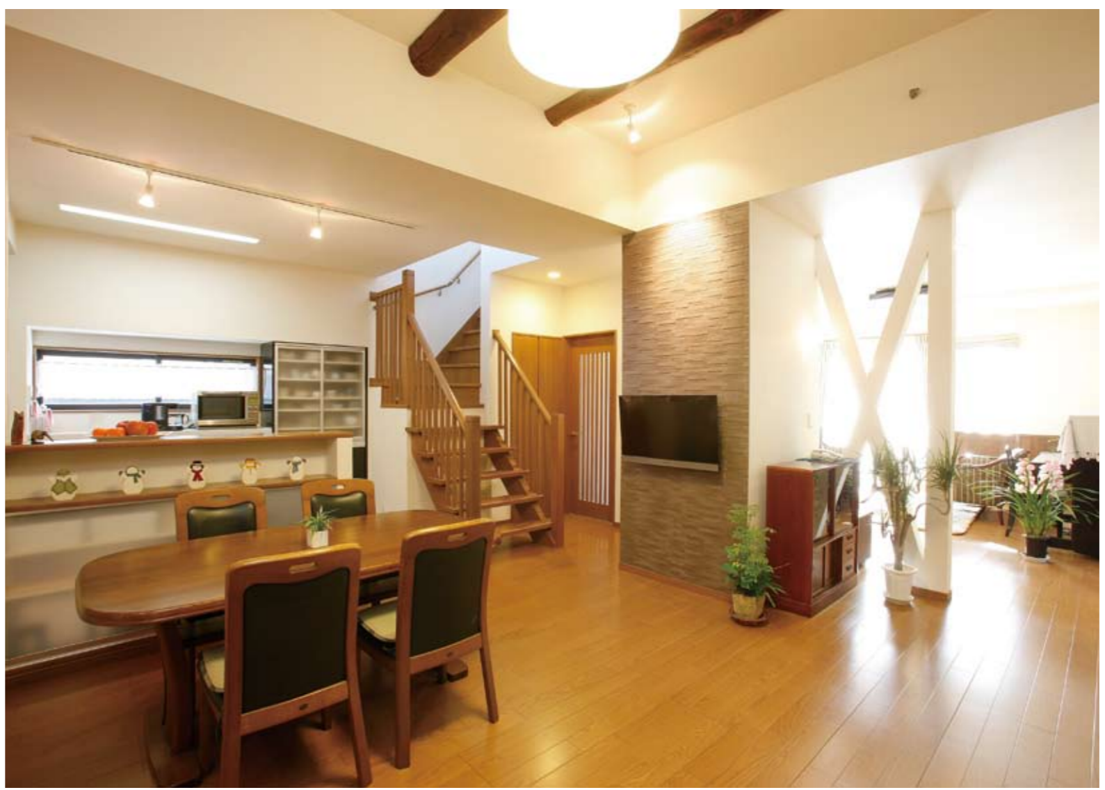
南から明るい光が届くDK。「モアリビングさんは、父の想いを大切にする母の希望で残した入母屋屋根に、増築した屋根の色を合わせたり、丸太梁も大事にしてくれました。新築も考えましたがリフォームで良かった。思い出をそのままに安心と暮らしやすさをプラスできました」