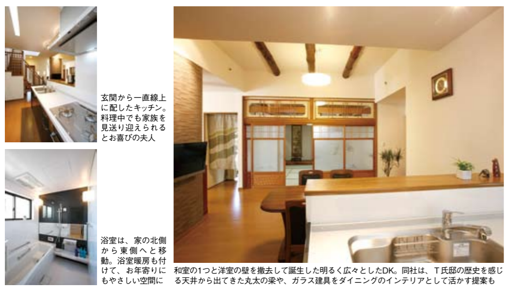
玄関から一直線上に配したキッチン。料理中でも家族を見送り迎えられると嬉しいお母さん