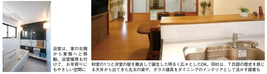
浴室は、家の北側から東側へと移動。浴室暖房も付けて、お年寄りにやさしい空間に