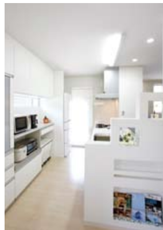
⑦キッチン横の段々のディスプレイ棚はガラススタイルとダウンライトでお洒落に演出