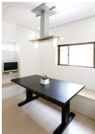
⑥ダイニングには夫が選んだ昇降式の換気扇を設置。照明付きで機能性も高い