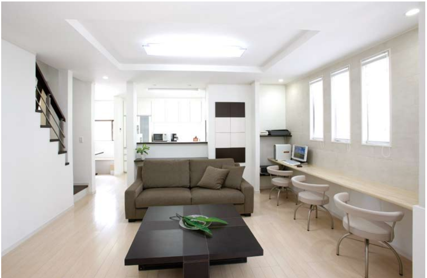
●階段をリビングに取り入れ、上り口を廊下からリビング側へ変更。小さなお子さんも恐がらずに2階へ上れるようになった。オープンなキッチンを空間の中央に配することで夫人のお悩みを解消