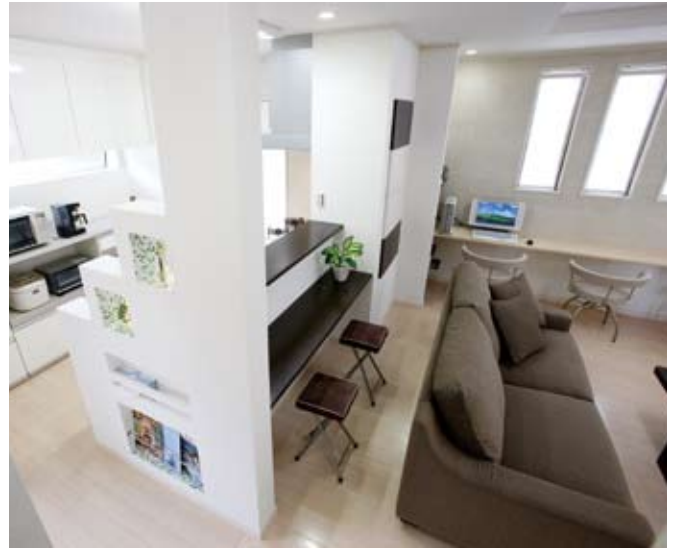
②「団樂の中で子供たちが勉強できる場所を」とリビングの一面にPCカウンターを設置。お子さんもお喜びでご家族一緒に過ごす時間が増えたそう。カウンター前の壁はエコカラット

システムキッチン クリナップ(クリンレディ) フローリング パナソニック(オールマイティフローリング) 玄関サッシ トステム (フォアード) 内装ドア 三協立山・YKK