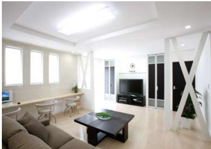
⑤構造上撤去できない柱や筋交いは内装と同じホワイトで化粧をしてデザインの一部に。TV横の収納扉は夫こだわりの逸品。表面だけでなく裏表に化粧が施されたドア用の扉をセレクト