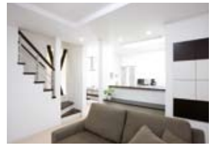
③階段は2トーンカラー+アルミの手すりですタイリッシュに。奥がダイニング