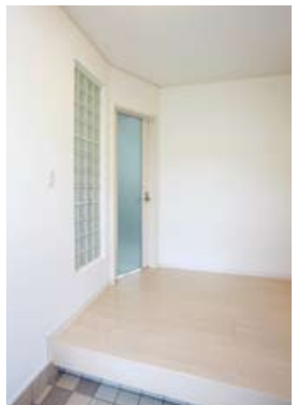
⑧玄関は採光に配慮しガラスブロックと半透明ドアを採用。リビングの光を届ける