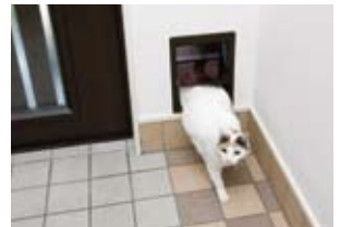
④玄関には愛猫専用ペットドアを設置。玄関ドアと同色の塗装で彼女もご機嫌