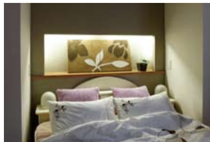
④寝室の正面の壁は大人っぽいグレーのクロスで落ち着いた雰囲気。間接照明が枕元をやさしく照らす