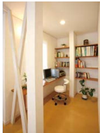
⑧リビング一画のパソコンコーナーには棚やカウンターも造作。今はご主人の書斎として活用