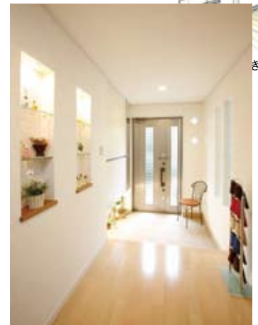
⑦玄関の壁にはニッチを配し見せる収納を提案。ドアの袖には菱型のガラスブロックを

本誌掲載の広告内容が事実と反する場合は 読者ホットライン☎0120-305-444まで