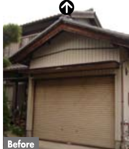
⑤明るい南面を占領していた車庫。しかも最近はお置物に化していた