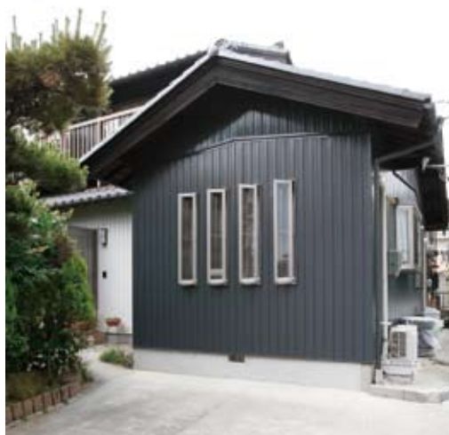
②黒壁でモダンな外観に变身。内側はスリット窓からの光と風が心地いい約21畳のLDKが誕生