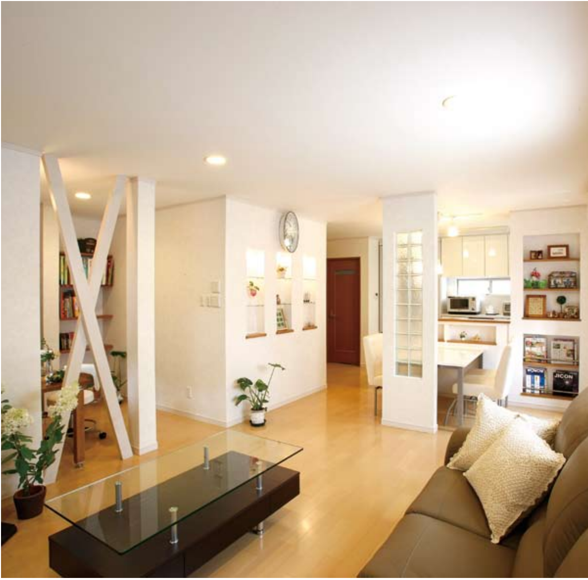
●大幅な間取り変更で生まれた明るいLDK。ニッチや納戸といった見せる収納と隠す収納を使い分けて空間はすっきり。Xの筋交いの奥はご主人のPCコーナー

女性プランナーをはじめスペシャリストによる 住み手のライフスタイルを重視したプラン提案