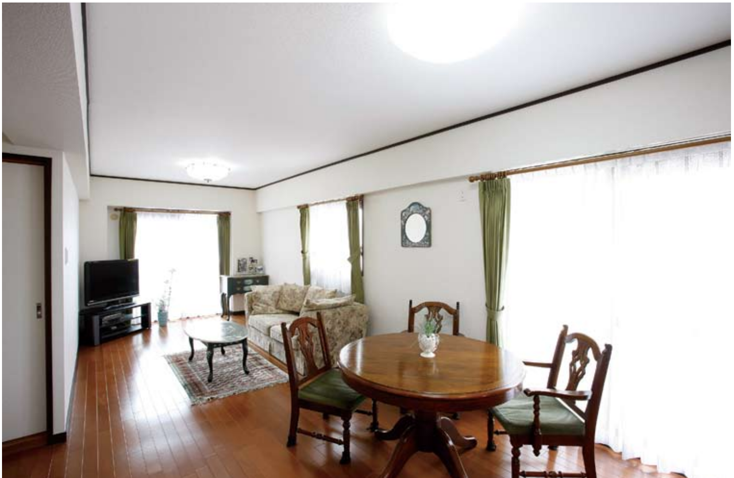
●DKと洋室を隔てていた壁を撤去し誕生した広々LDK。ソファで寝転がりテレビを見ながらゆったり過ごせるご主人お気に入りのスペース。既存家具とのバランスを考え床は明るめのフローリングに