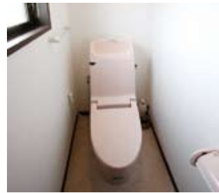
④トイレには超節水型で掃除が楽な便座を採用。「主婦の味方です」と笑顔の奥様