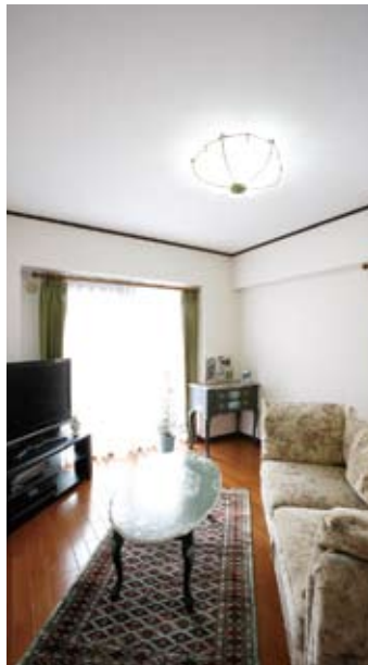
⑦シンプルなインテリア空間は奥様の趣味のフオークアート家具と見事にマッチしている