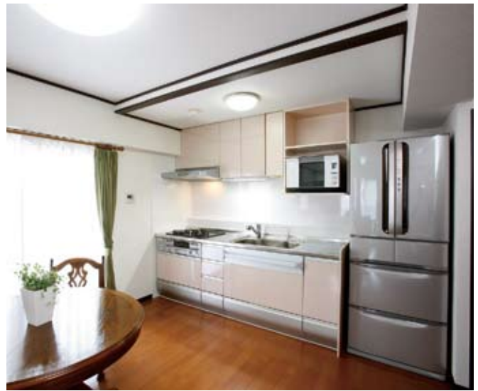
②システムキッチンの色は淡いピンクをチョイスし爽やかな清潔感を演出。キッチンと同色の電子レンジ台を吊り戸棚横に造作。そのおかげでワークスペースが広がった