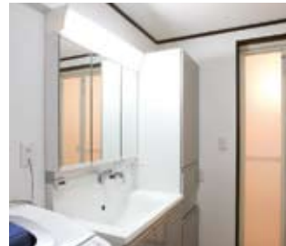
⑥ホワイトの洗面台で明るく清潔感溢れる空間へと変身。収納も必要量を確保