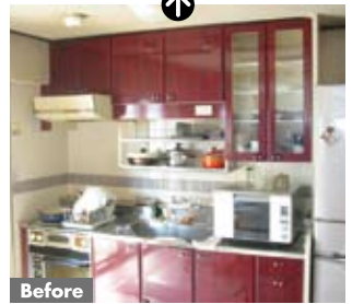
③ワークトップを電子レンジが占拠し作業スペース不足だった施工前のキッチン