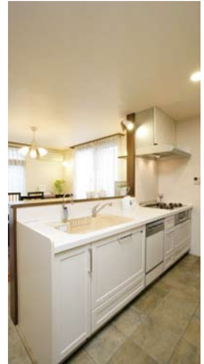
⑨清潔感漂うホワイトのキッチン。床はLDと同じく愛犬のチャアくんが滑りにくいタイルをセレクト