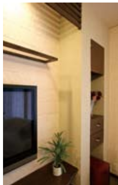
⑦新しく造ったTVコーナーの壁はエコカラットと珪藻土仕上