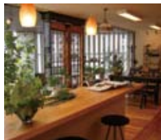
モアリビングガーデンの店内