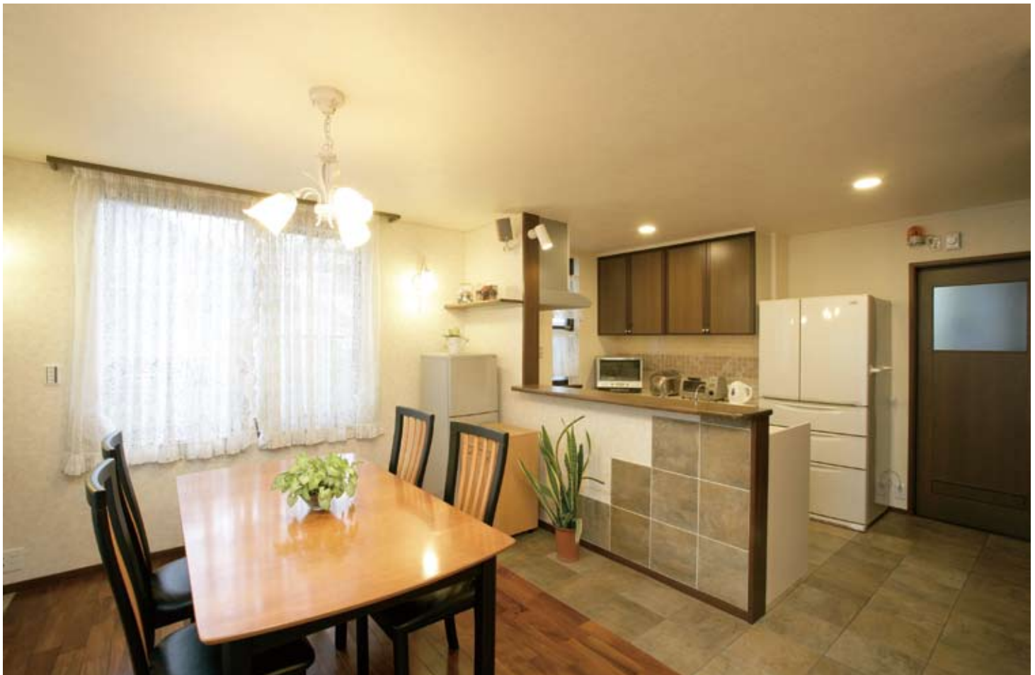
●リビング側からキッチンを見む。キッチンの吊り戸棚を撤去し開放的なダイニングキッチンを実現。カウンターの立ち上がり部分にも床と同タイルを貼り、より空間の一体化を図った優れたデザイン