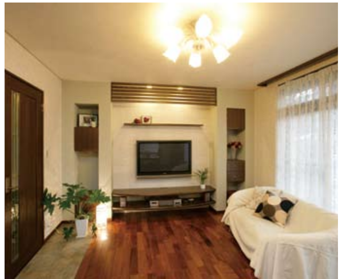
②ご家族が集うLDKにコストをかけ、ご主人念願のシアターリビングが完成。溢れていた物はユーティリティに設置した棚や引き出しに収納し、スッキリとした空間が誕生した