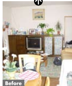
④物が溢れて雑然とした印象だった施工前のリビング