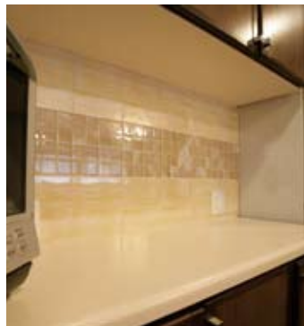
⑧キッチンの壁はイタリア製のガラススタイルでスタイリッシュに演出