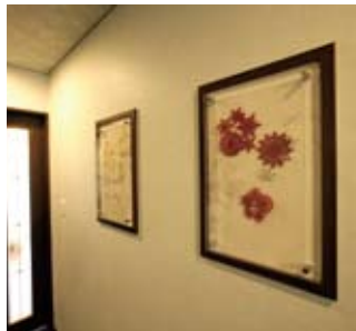
⑤木とアクリル板で造作した立体的なディスプレイフレームは奥様のお気に入り